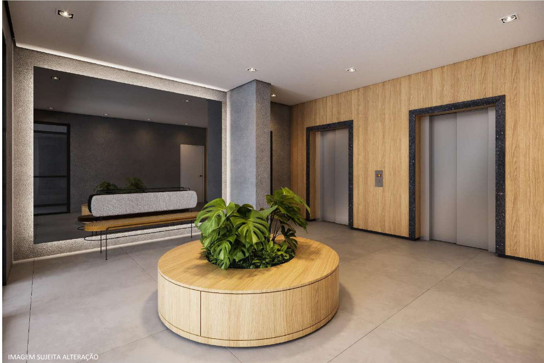
IMAGEM SUJEITA ALTERAÇÃO