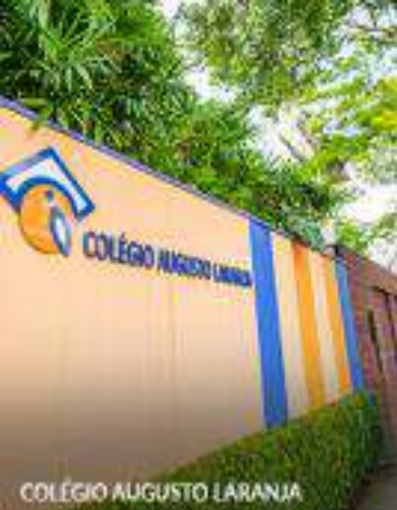
COLÉGIO AUGUSTO LARANJA