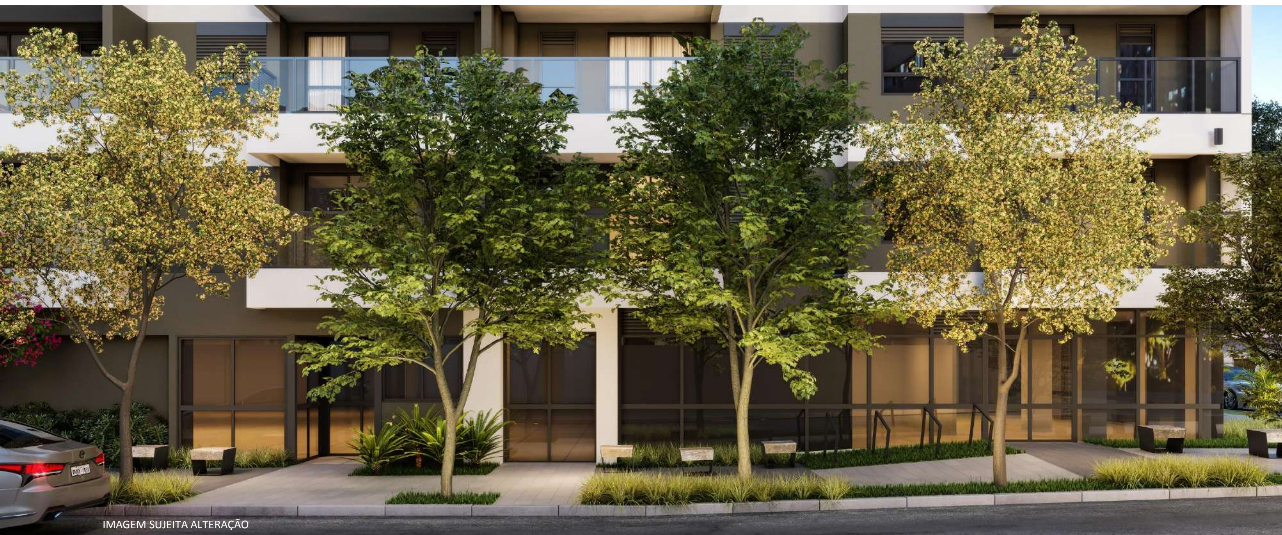
IMAGEM SUJEITA ALTERAÇÃO