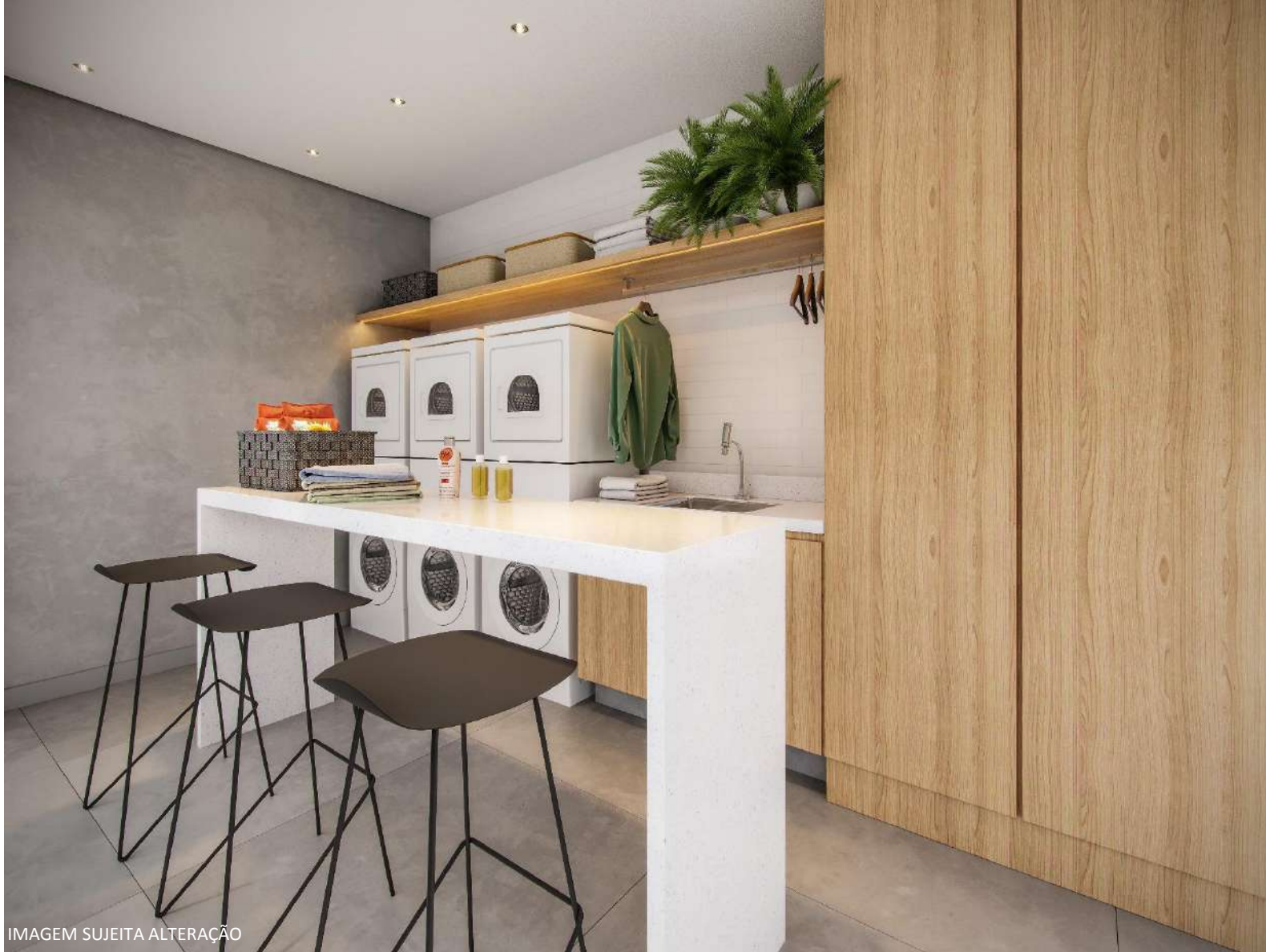
IMAGEM SUJEITA ALTERAÇÃO