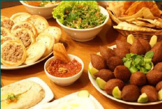
FESTIVAL DE ÁRABE