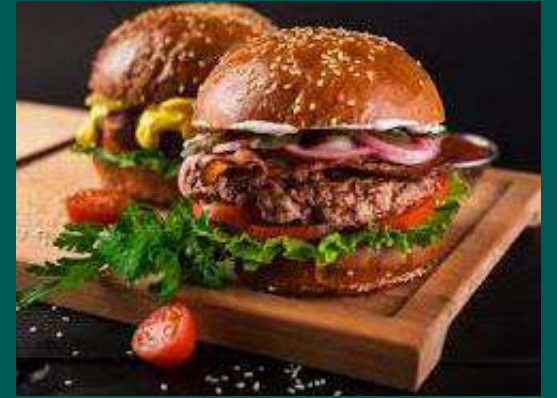
FESTIVAL DE HAMBURGUER