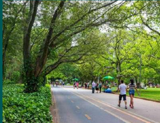
BLITZ PARQUE IBIRAPUERA