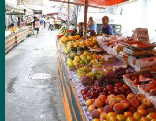
BLITZ EM FEIRAS LIVRES