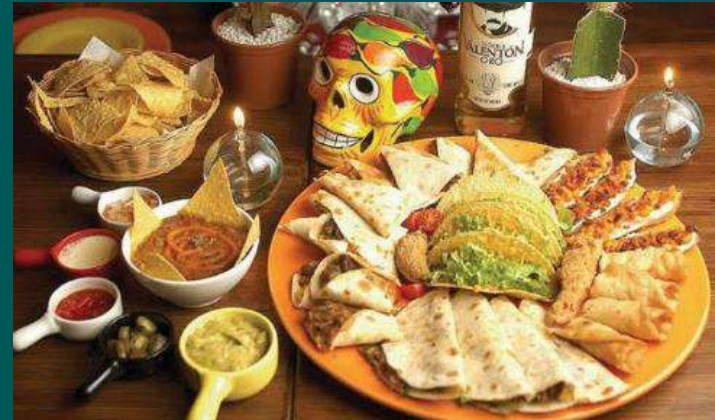
FESTIVAL DE MEXICANO