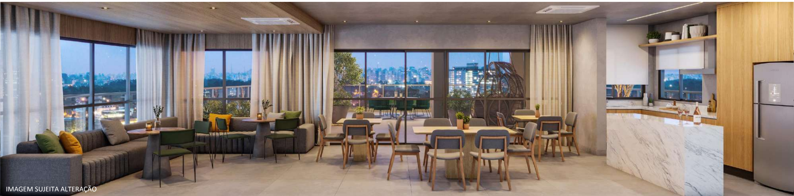
IMAGEM SUJEITA ALTERAÇÃO