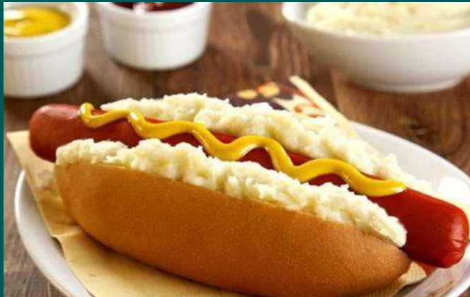
FESTIVAL DE HOT DOG