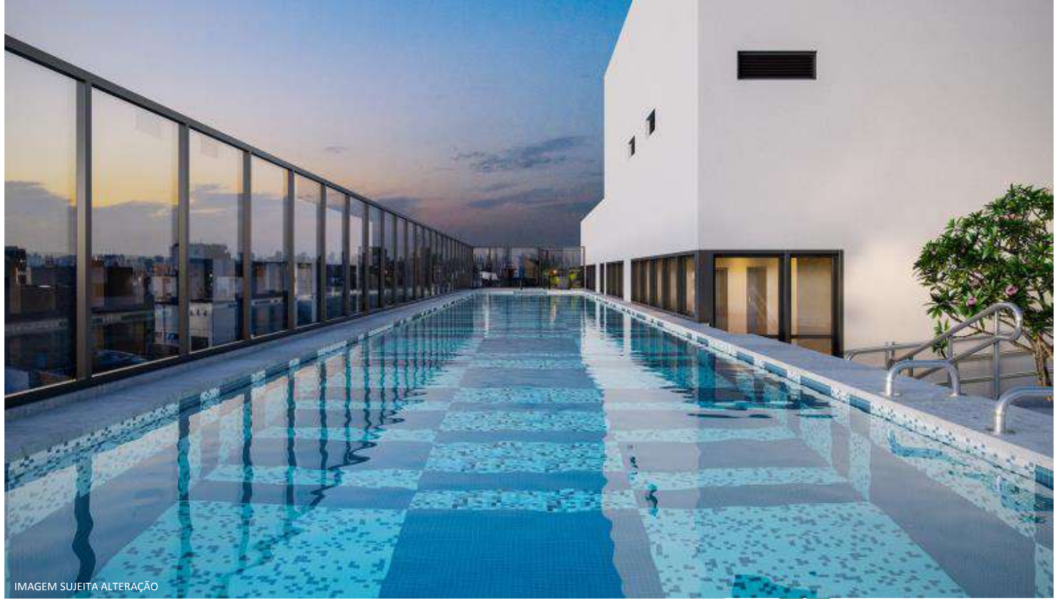
IMAGEM SUJEITA ALTERAÇÃO