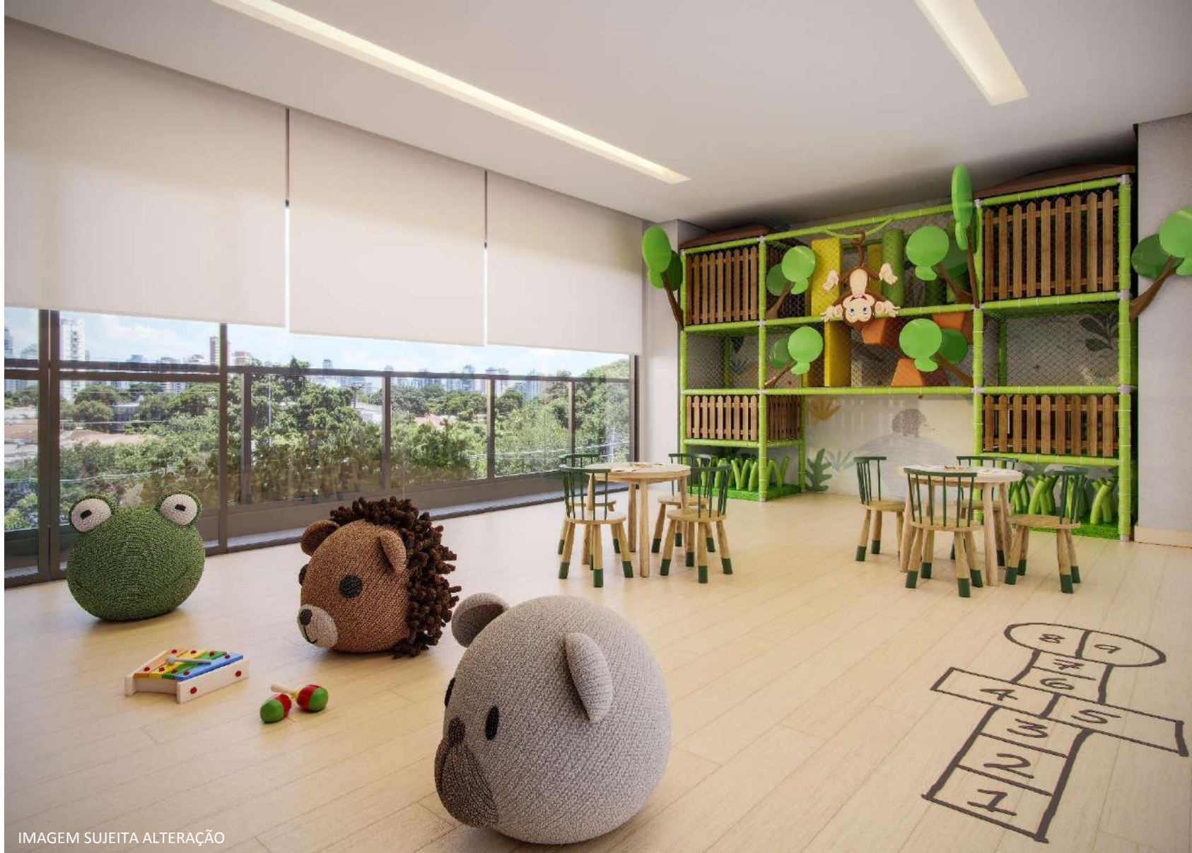
IMAGEM SUJEITA ALTERAÇÃO