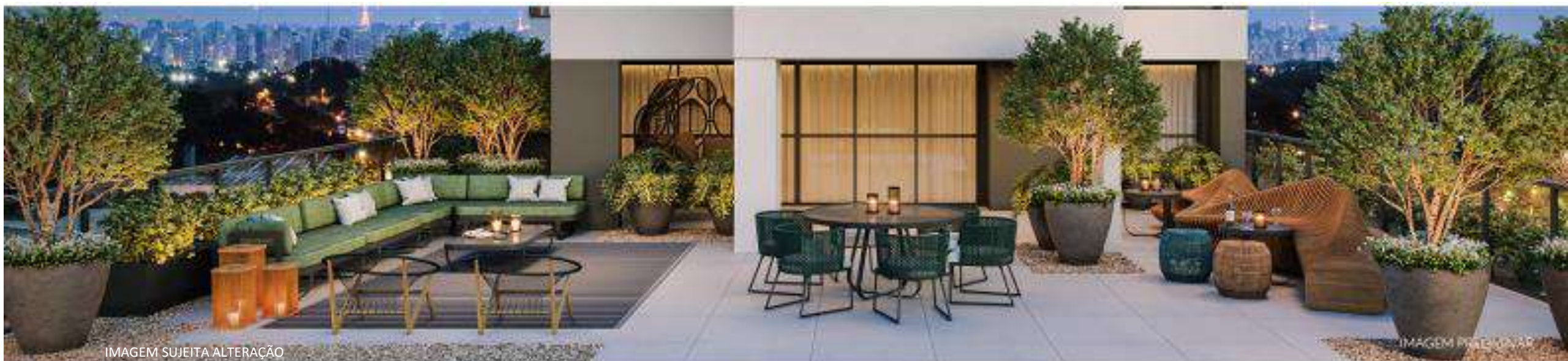
IMAGEM SUJEITA ALTERAÇÃO