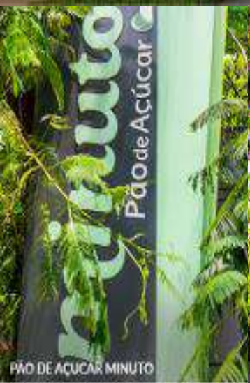
PÃO DE AÇÚCAR MINUTO