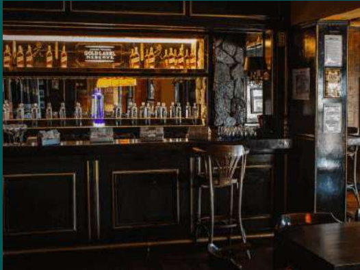
BLITZ EM BARES