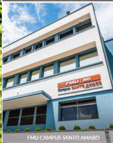
FMU CAMPUS SANTO AMARO