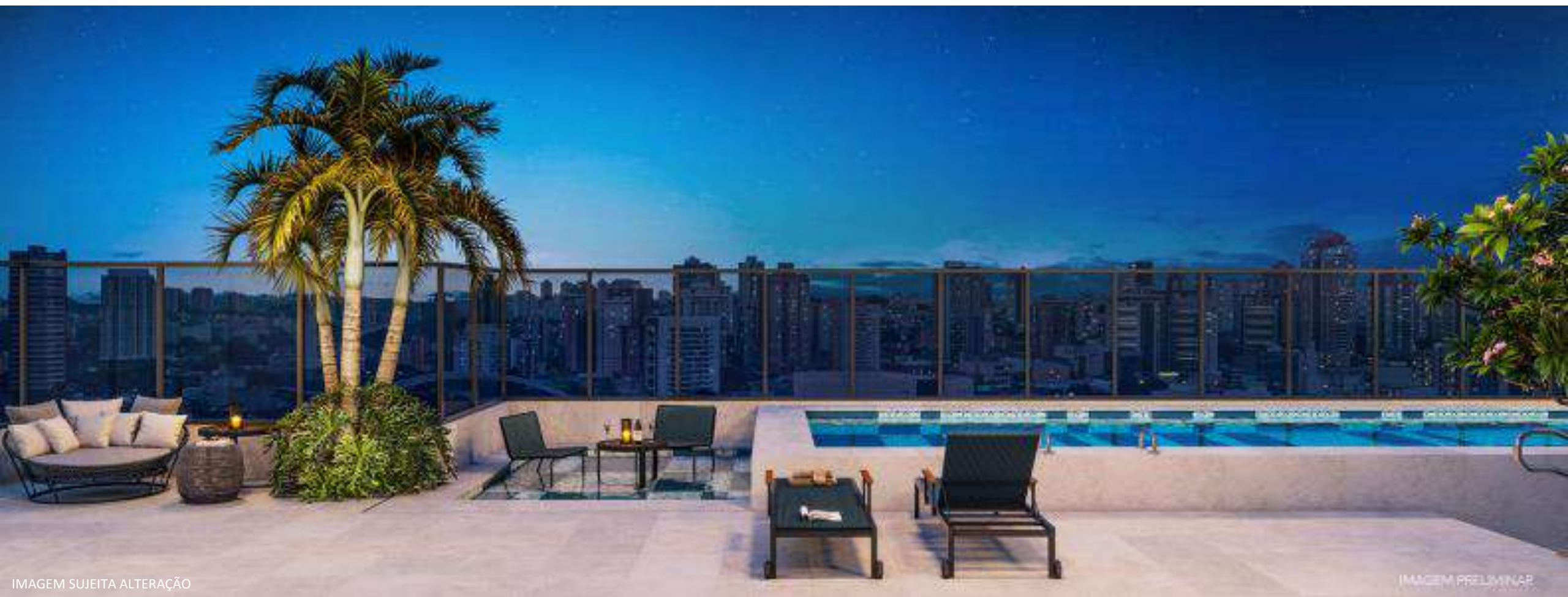
IMAGEM SUJEITA ALTERAÇÃO