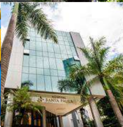
HOSPITAL SANTA PAULA