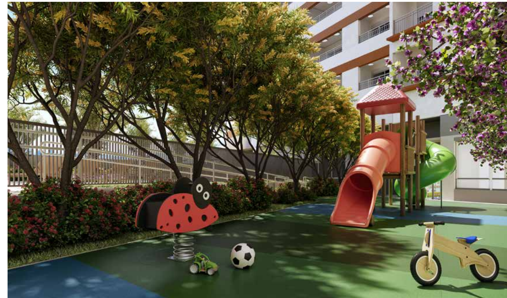
PERSPECTIVA ILUSTRADA DO PLAYGROUND ÁREA EXCLUSIVA DO SETOR RESIDENCIAL - TORRE ACÁCIA