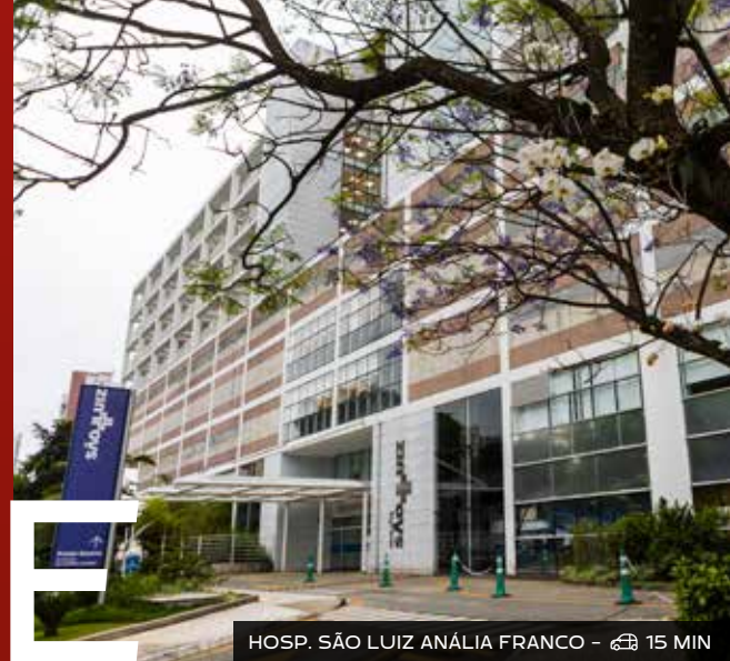
HOSP. SÃO LUIZ ANÁLIA FRANCO - 15 MIN

PARA VOCÊ MORAR COM TRANQUILIDADE E, AO MESMO TEMPO, VIVER CONECTADO AO MELHOR DA CIDADE.