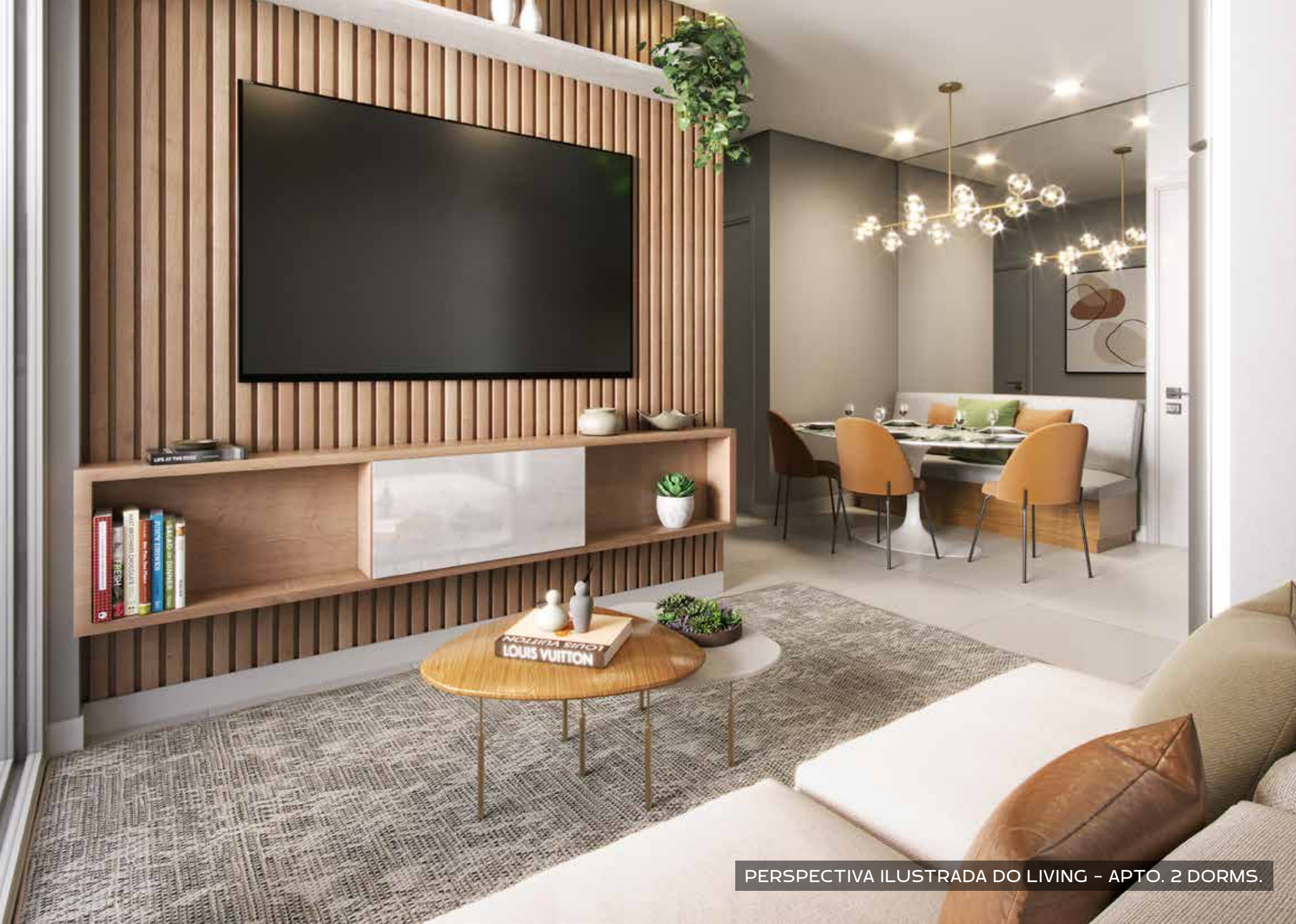
PERSPECTIVA ILUSTRADA DO LIVING - APTO. 2 DORMS.