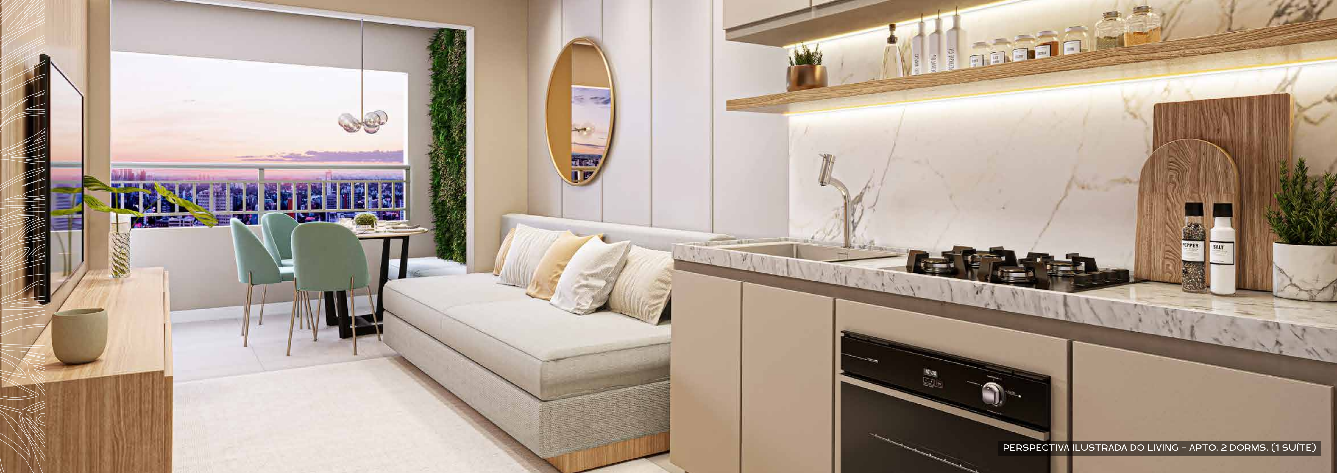
PERSPECTIVA ILUSTRADA DO LIVING - APT. 2 DORMS. (1 SUÍTE)