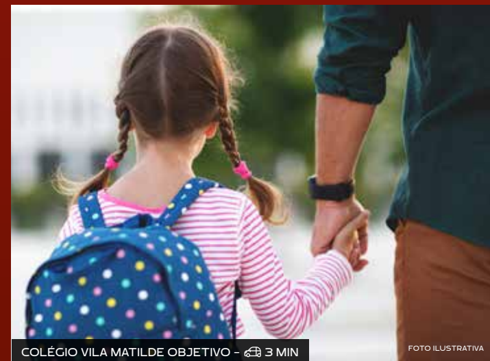
COLÉGIO VILA MATILDE OBJETIVO - 3 MIN