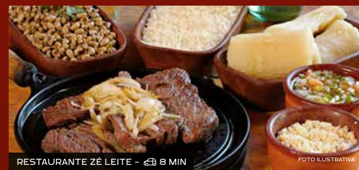
RESTAURANTE ZÉ LEITE - 8 MIN