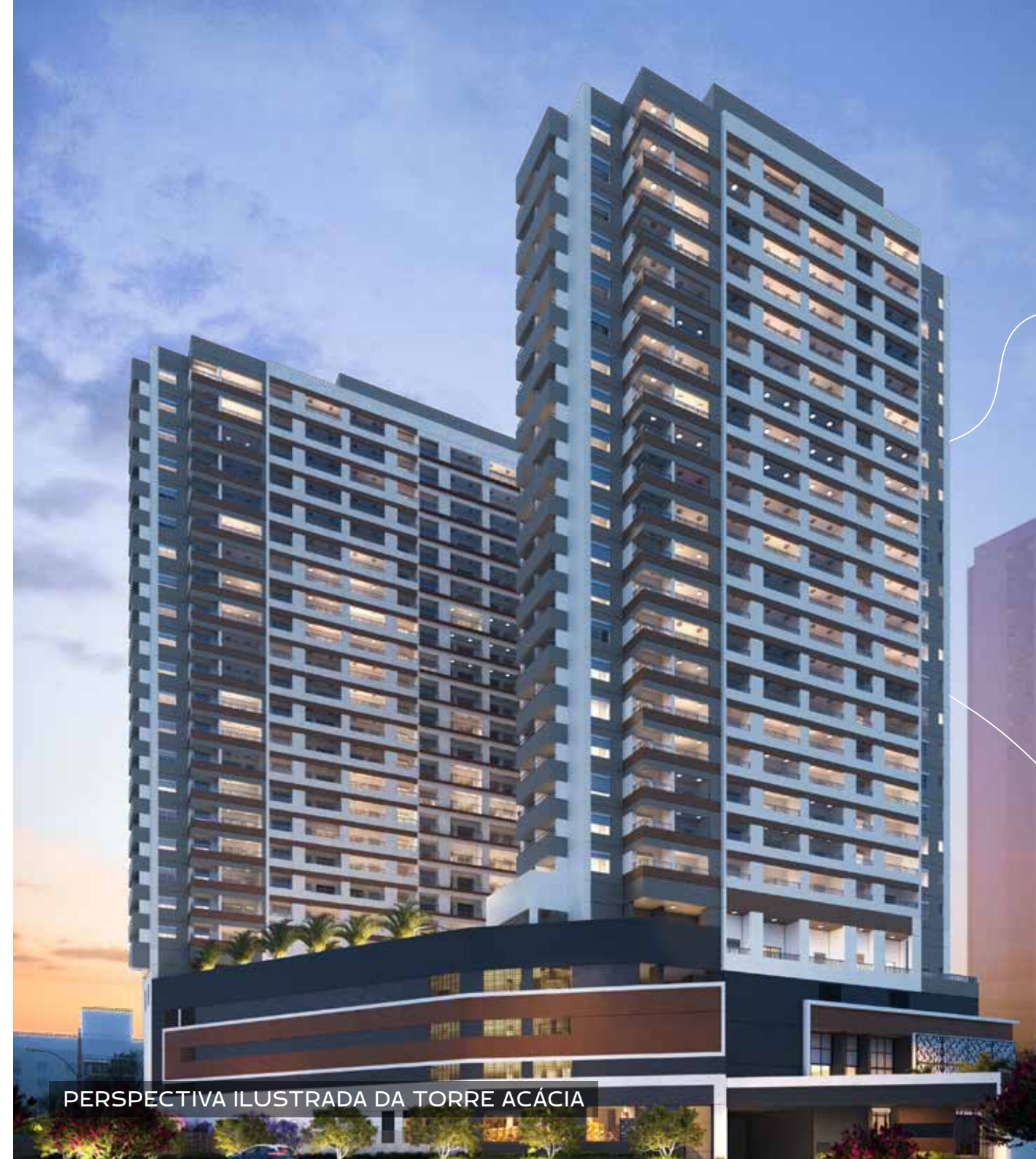
PERSPECTIVA ILUSTRADA DA TORRE ACÁCIA

Escritório de arquitetura paisagística, planejamento urbano e ambiental, atuando no planejamento de áreas externas de edifícios residenciais, comerciais e institucionais, loteamentos, praças, parques e áreas livres, desde Março de 1999. A Núcleo Arquitetura da Paisagem tem refletido em seu trabalho a união entre meio ambiente, arte e paisagismo potencializando as vocações de cada projeto em um conjunto harmonioso e integrado à arquitetura e à paisagem.