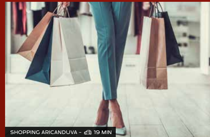
SHOPPING ARICANDUVA - 19 MIN