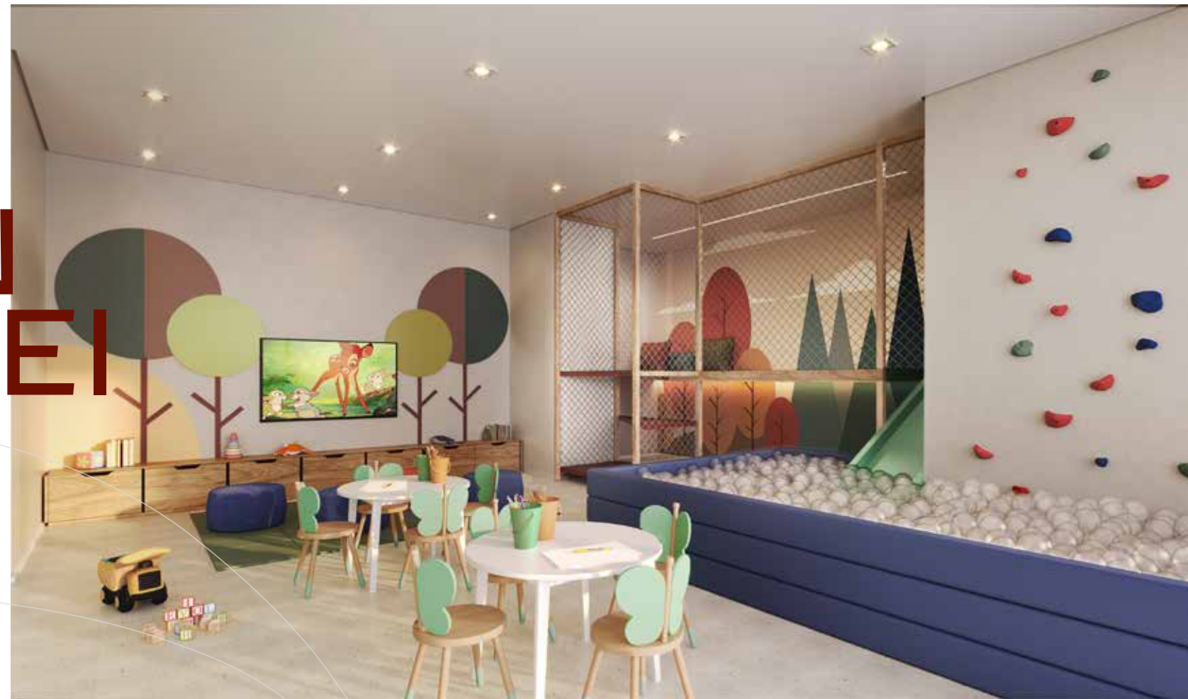
PERSPECTIVA ILUSTRADA DA BRINQUEDOTECA ÁREA EXCLUSIVA DO SETOR RESIDENCIAL - TORRE ACÁCIA