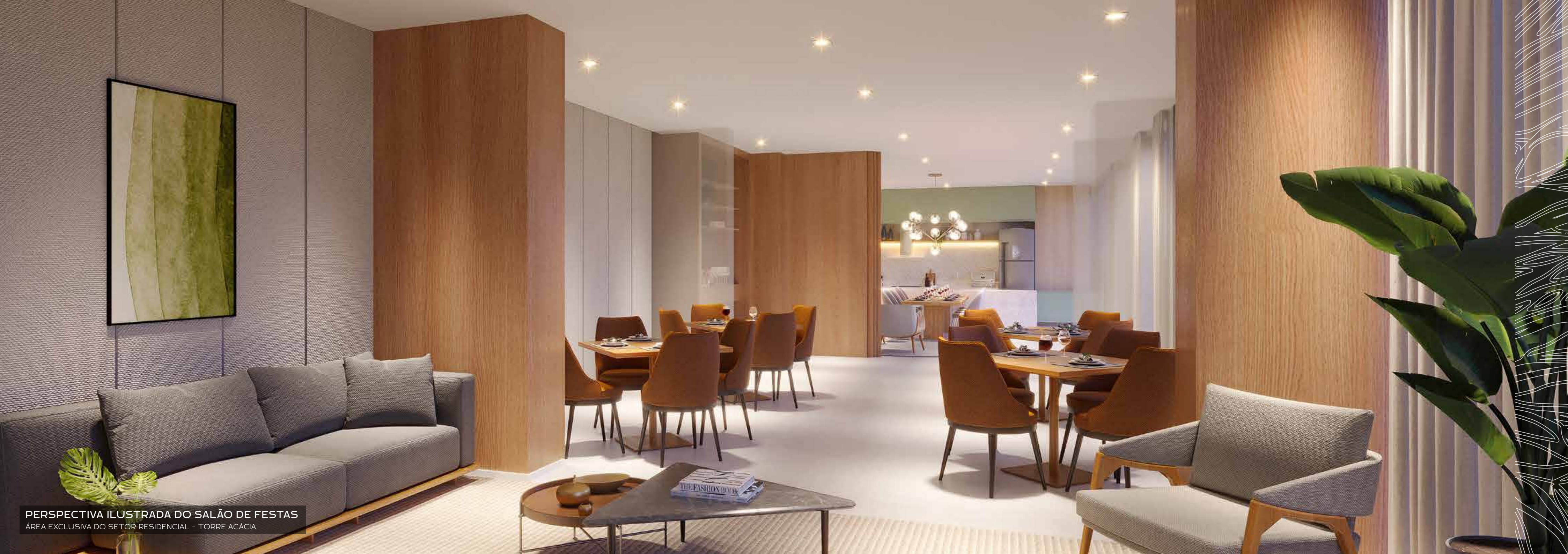
PERSPECTIVA ILUSTRADA DO SALÃO DE FESTAS ÁREA EXCLUSIVA DO SETOR RESIDENCIAL - TORRE ACÁCIA