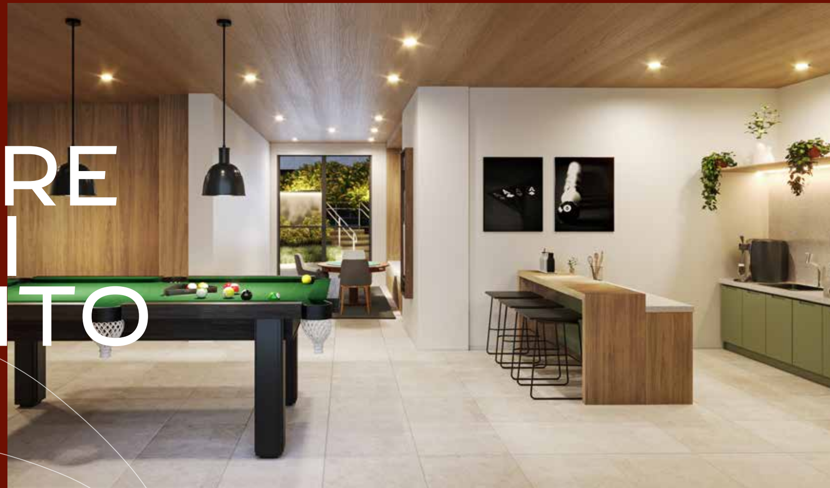
PERSPECTIVA ILUSTRADA DO SPORTS BAR ÁREA EXCLUSIVA DO SETOR RESIDENCIAL - TORRE ACÁCIA