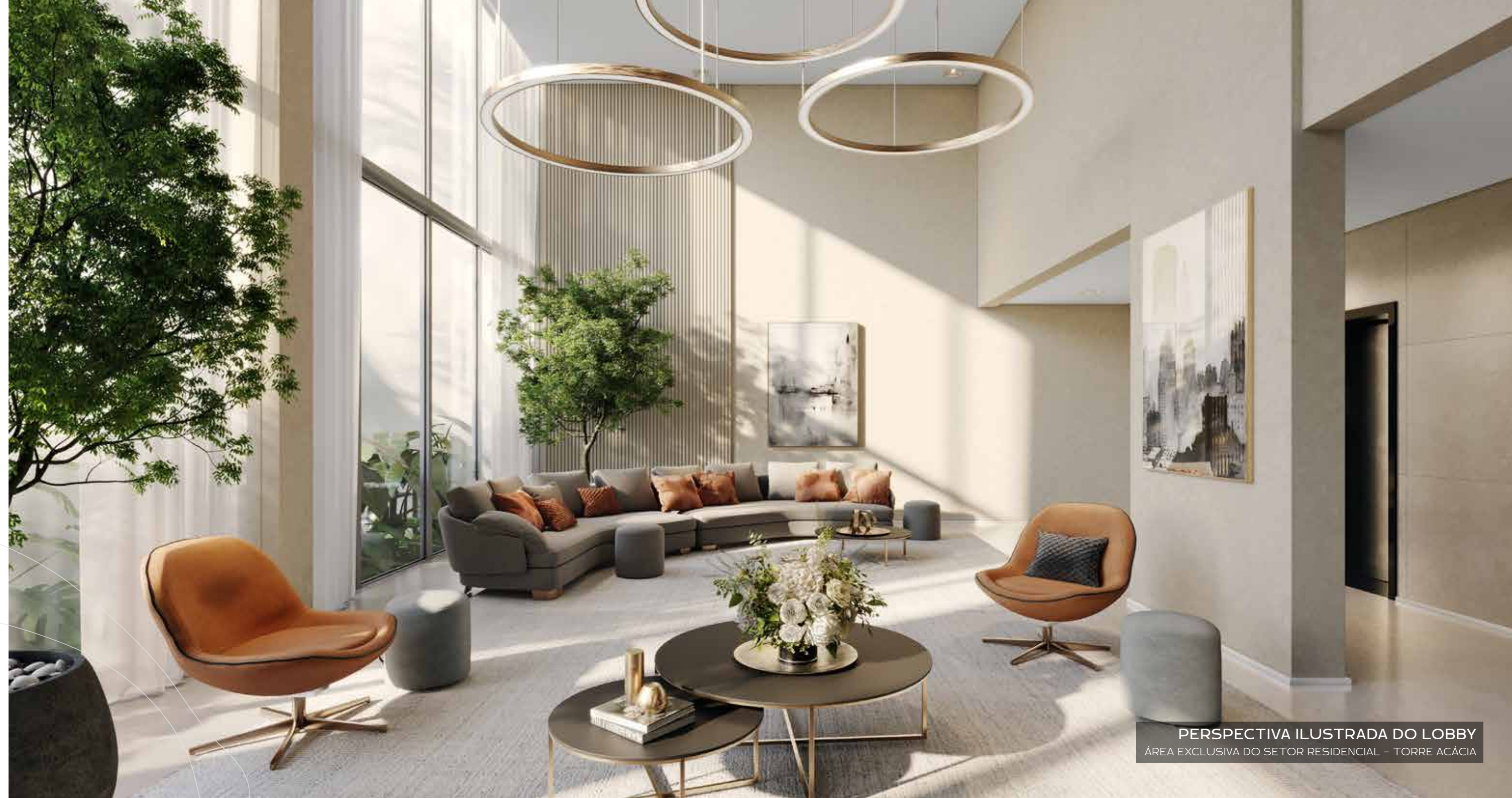
PERSPECTIVA ILUSTRADA DO LOBBY ÁREA EXCLUSIVA DO SETOR RESIDENCIAL - TORRE ACÁCIA