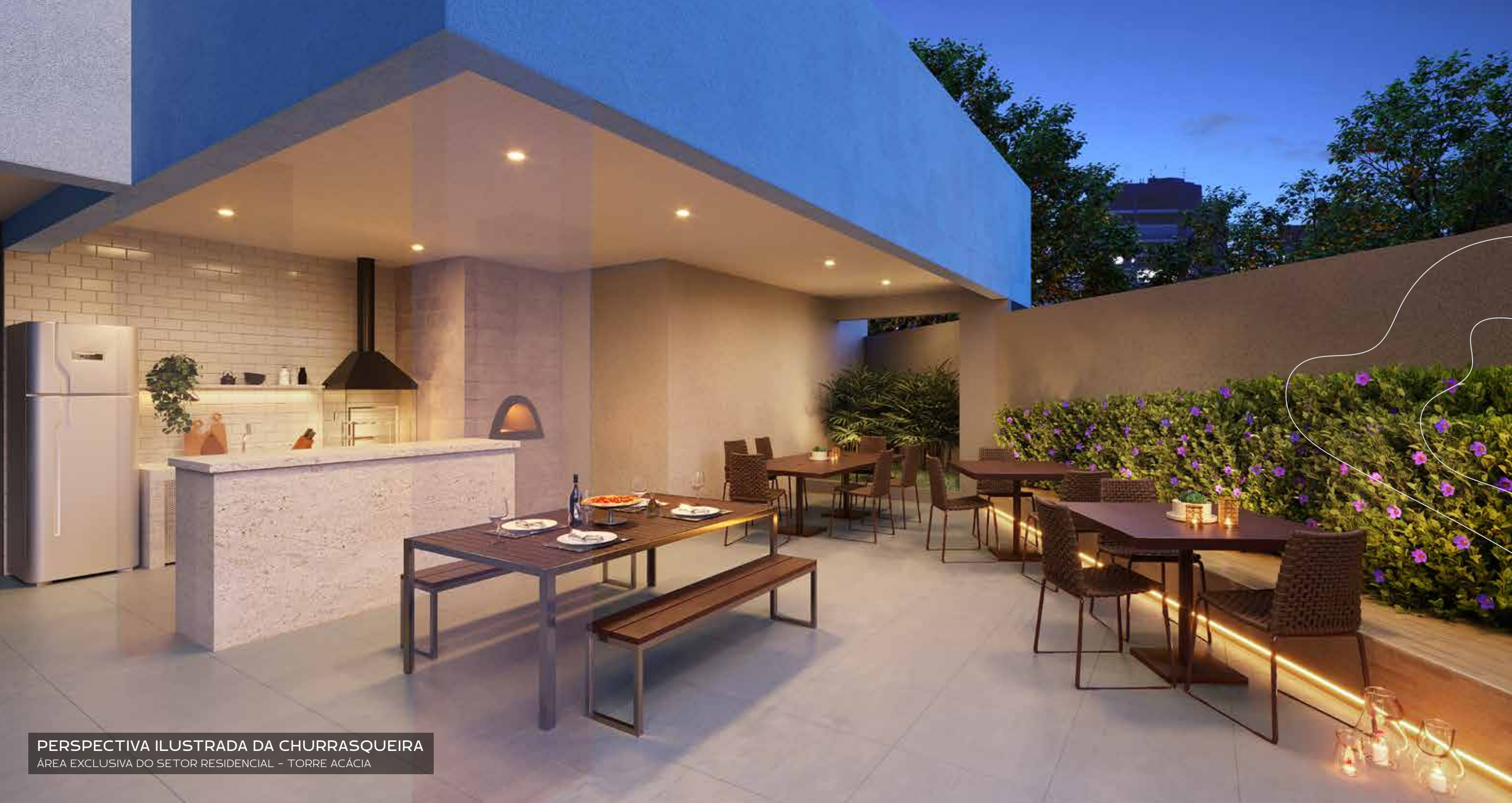
PERSPECTIVA ILUSTRADA DA CHURRASQUEIRA ÁREA EXCLUSIVA DO SETOR RESIDENCIAL - TORRE ACÁCIA