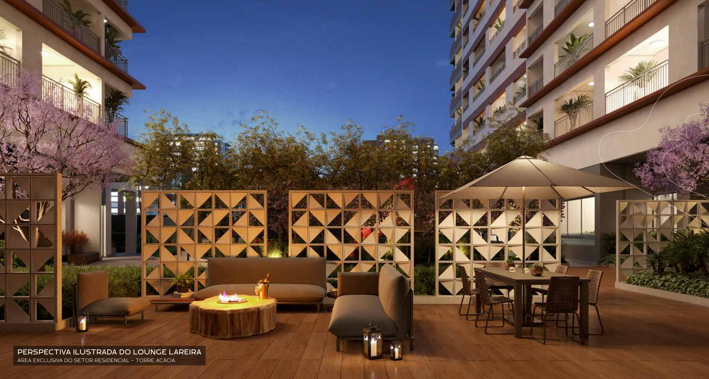
PERSPECTIVA ILUSTRADA DO LOUNGE LAREIRA ÁREA EXCLUSIVA DO SETOR RESIDENCIAL - TORRE ACÁCIA

APROVEITAR BONS MOMENTOS COM QUEM VOCÊ AMA.