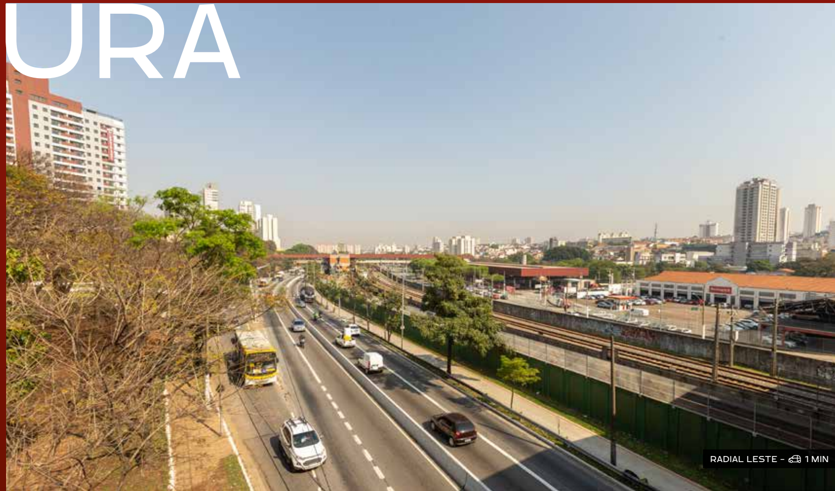
RADIAL LESTE - 1 MIN