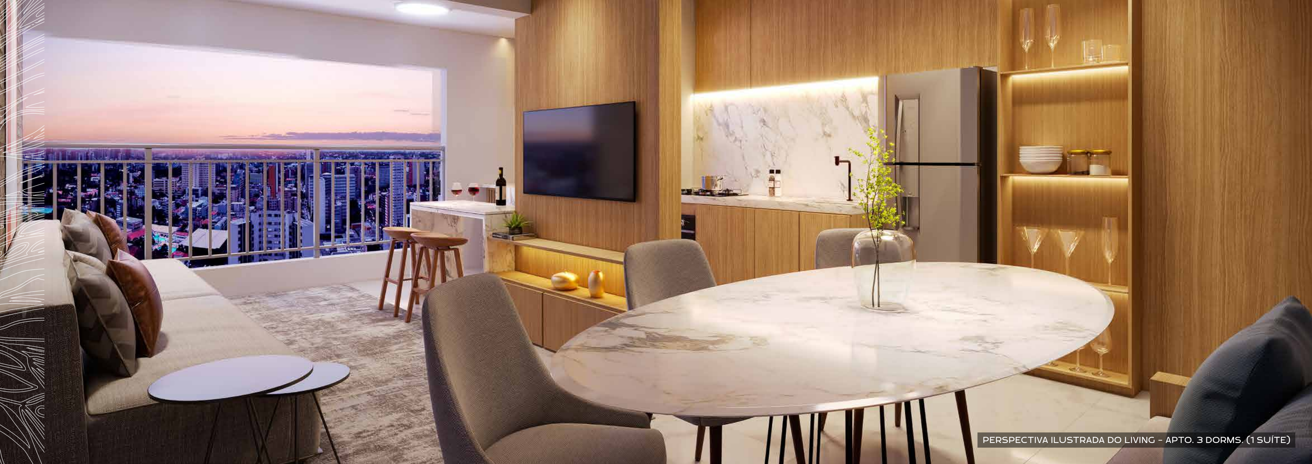
PERSPECTIVA ILUSTRADA DO LIVING - APTO. 3 DORMS. (1 SUÍTE)