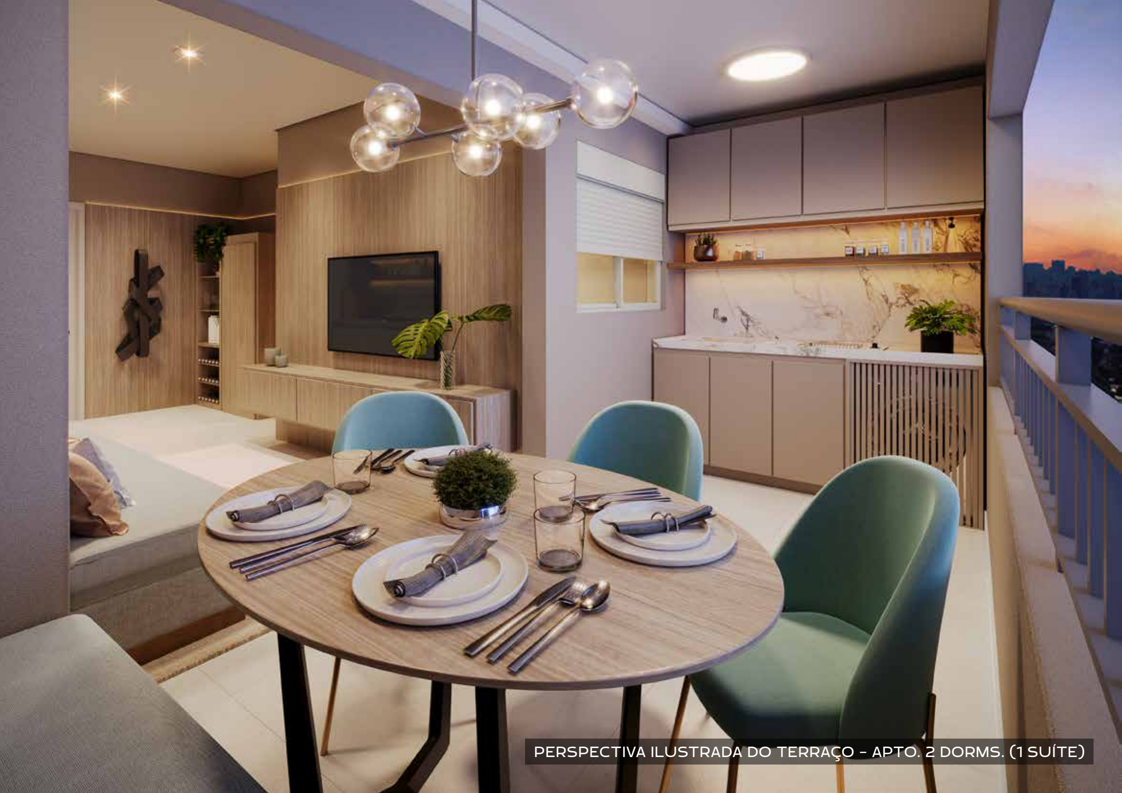
PERSPECTIVA ILUSTRADA DO TERRAÇO - APTO. 2 DORMS. (1 SUÍTE)