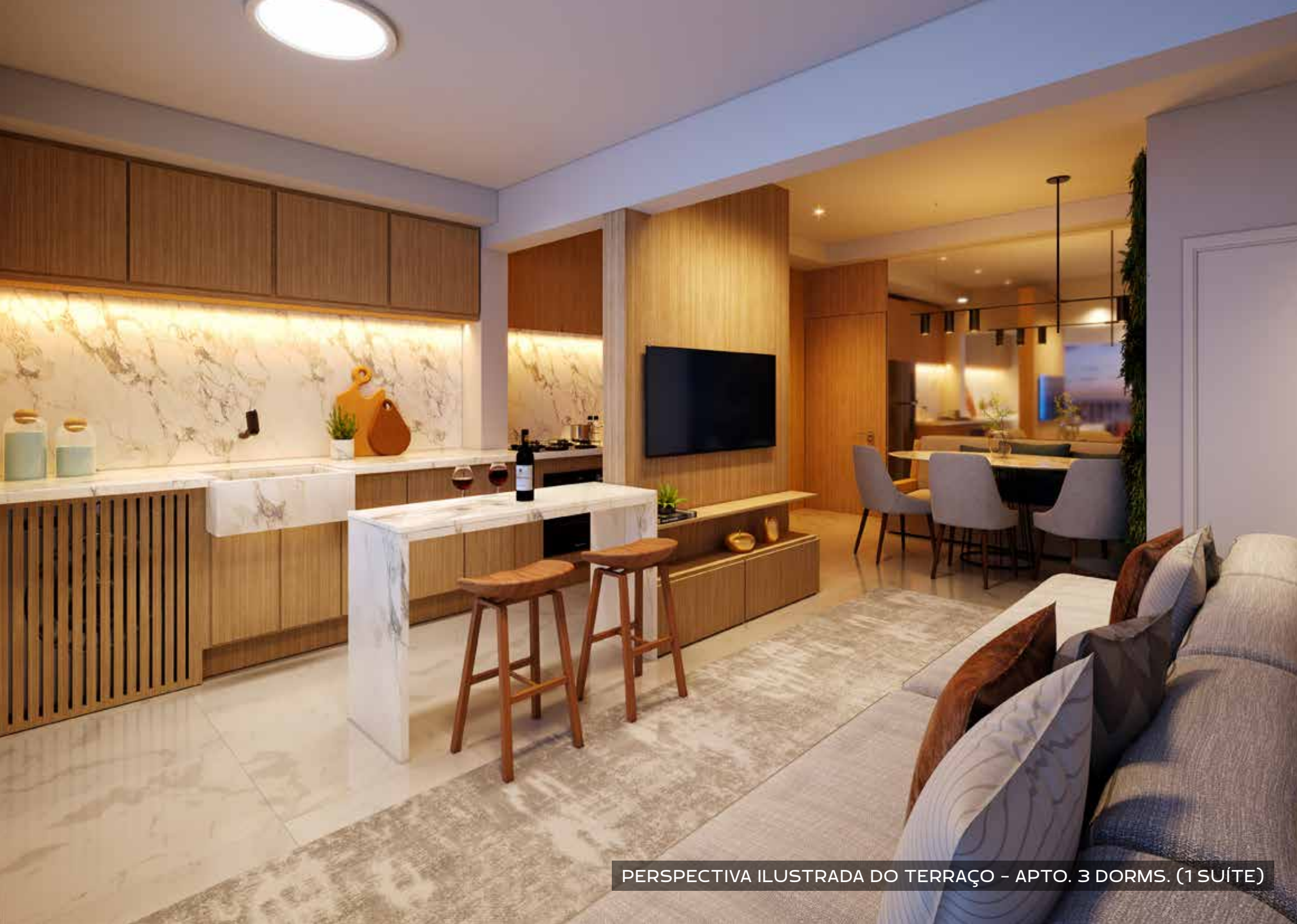
PERSPECTIVA ILUSTRADA DO TERRAÇO - APTO. 3 DORMS. (1 SUÍTE)