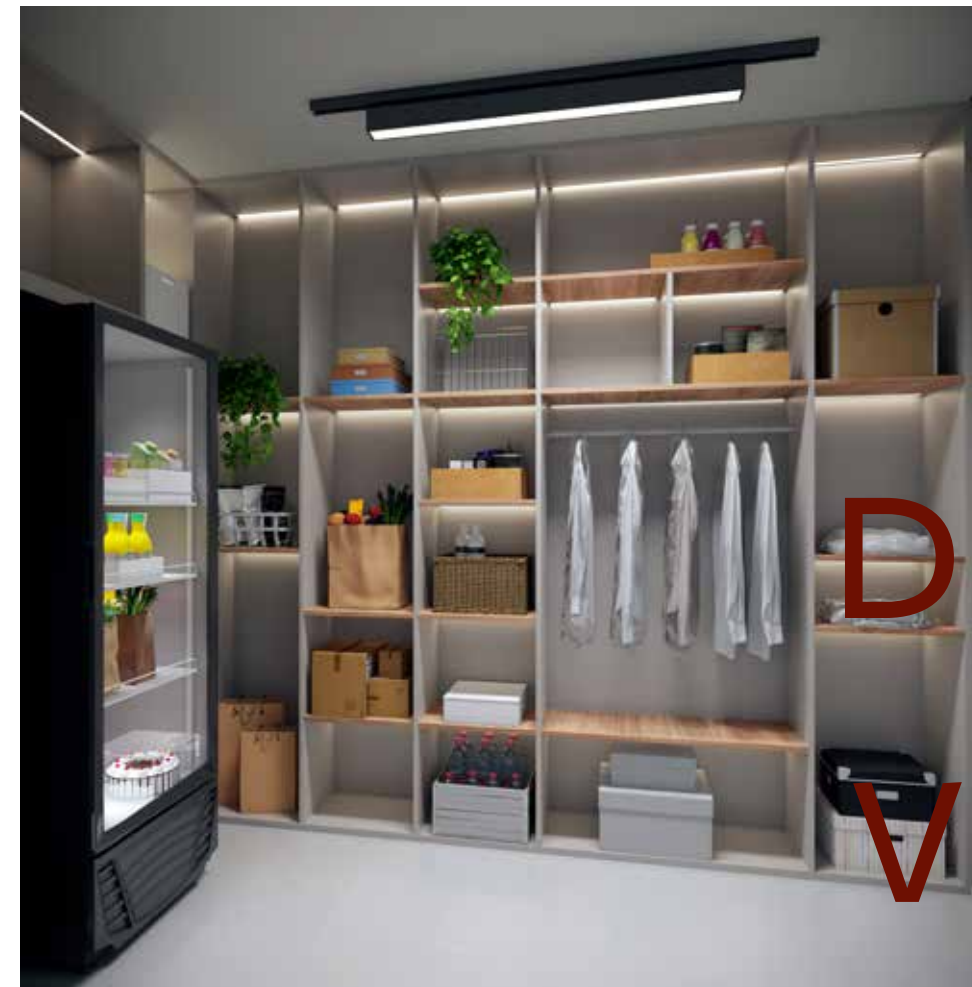
PERSPECTIVA ILUSTRADA DO DELIVERY ÁREA EXCLUSIVA DO SETOR RESIDENCIAL - TORRE ACÁCIA

SUAS ENCOMENDAS SERÃO ENTREGUES DE FORMA SEGURA E ORGANIZADA.