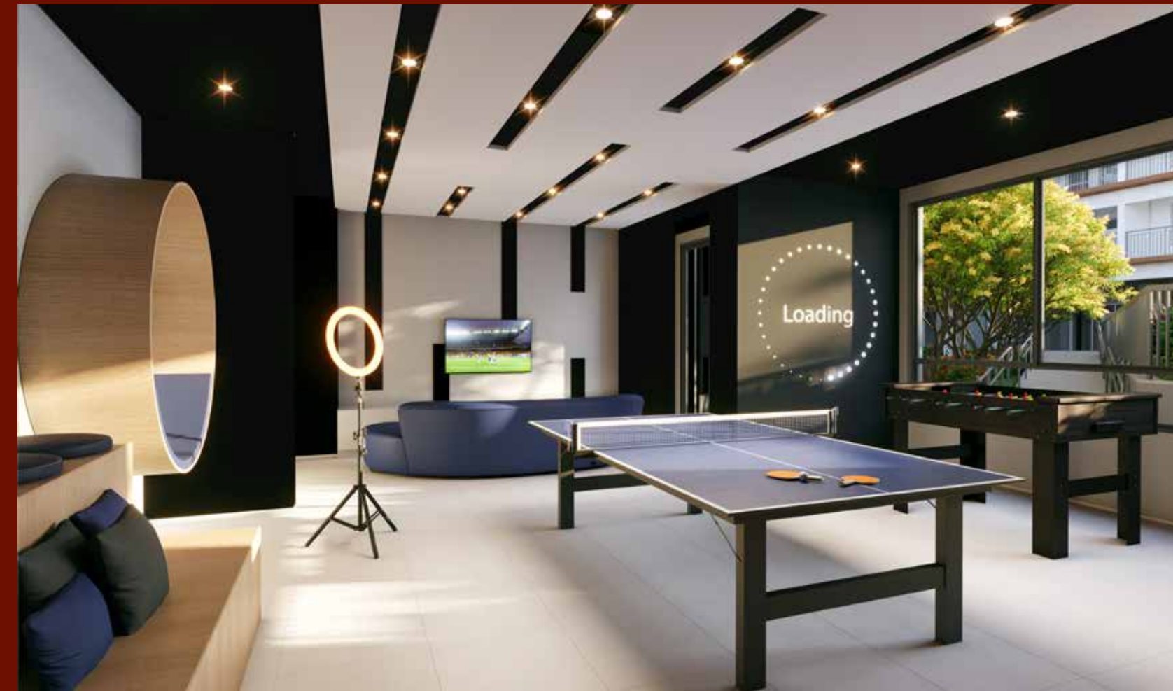
PERSPECTIVA ILUSTRADA DO SALÃO DE JOGOS ÁREA EXCLUSIVA DO SETOR RESIDENCIAL - TORRE ACÁCIA