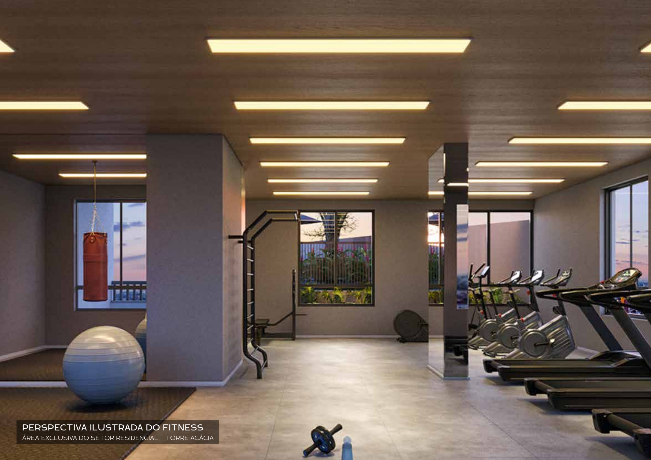
PERSPECTIVA ILUSTRADA DO FITNESS ÁREA EXCLUSIVA DO SETOR RESIDENCIAL - TORRE ACÁCIA