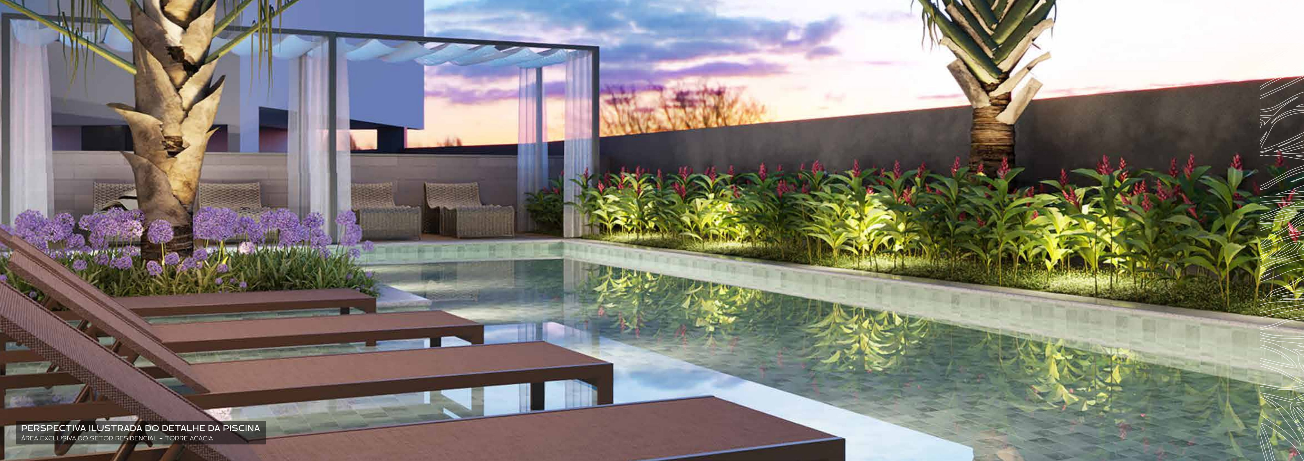
PERSPECTIVA ILUSTRADA DO DETALHE DA PISCINA ÁREA EXCLUSIVA DO SETOR RESIDENCIAL - TORRE ACÁCIA