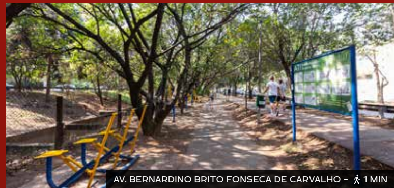
AV. BERNARDINO BRITO FONSECA DE CARVALHO - 1 MIN