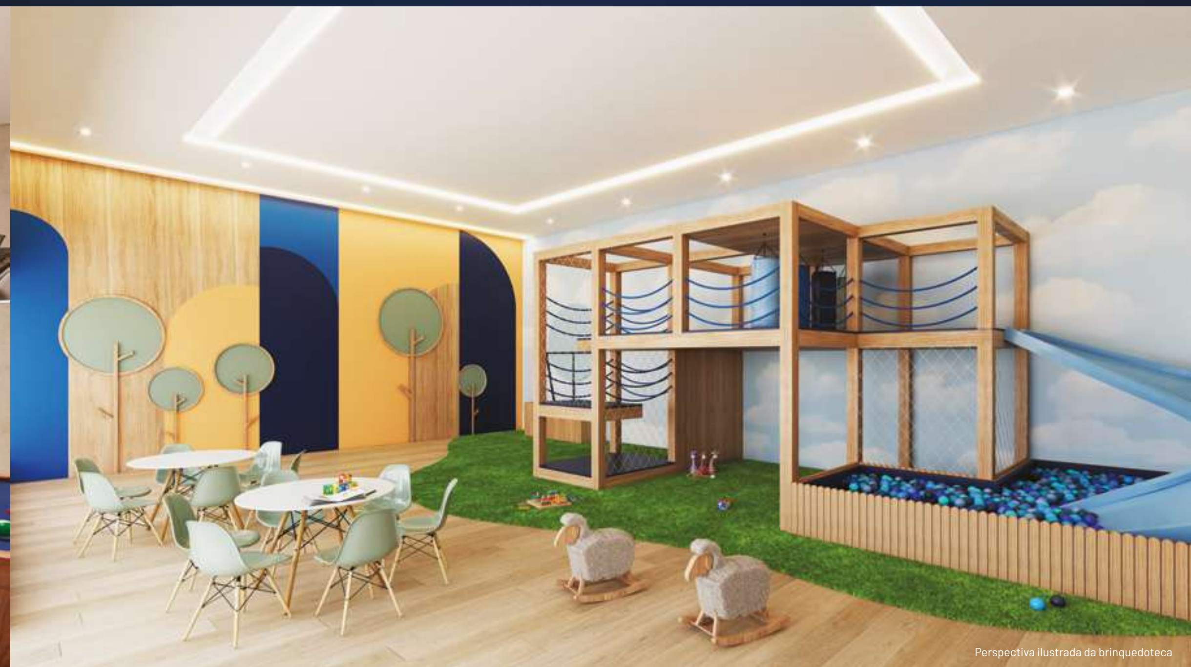
Perspectiva ilustrada da brinquedoteca