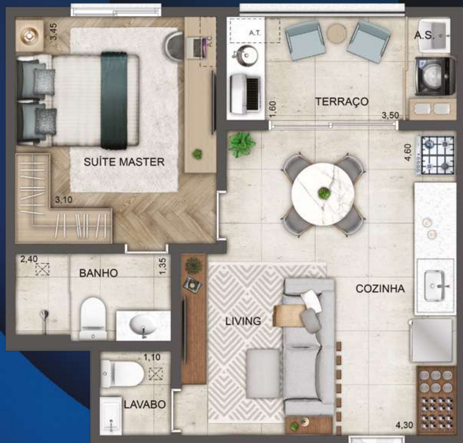
SUÍTE | LAVABO

A MEDIDA CERTA PARA QUEM QUER PRATICIDADE SEM ABRIR MÃO DA PRIVACIDADE.