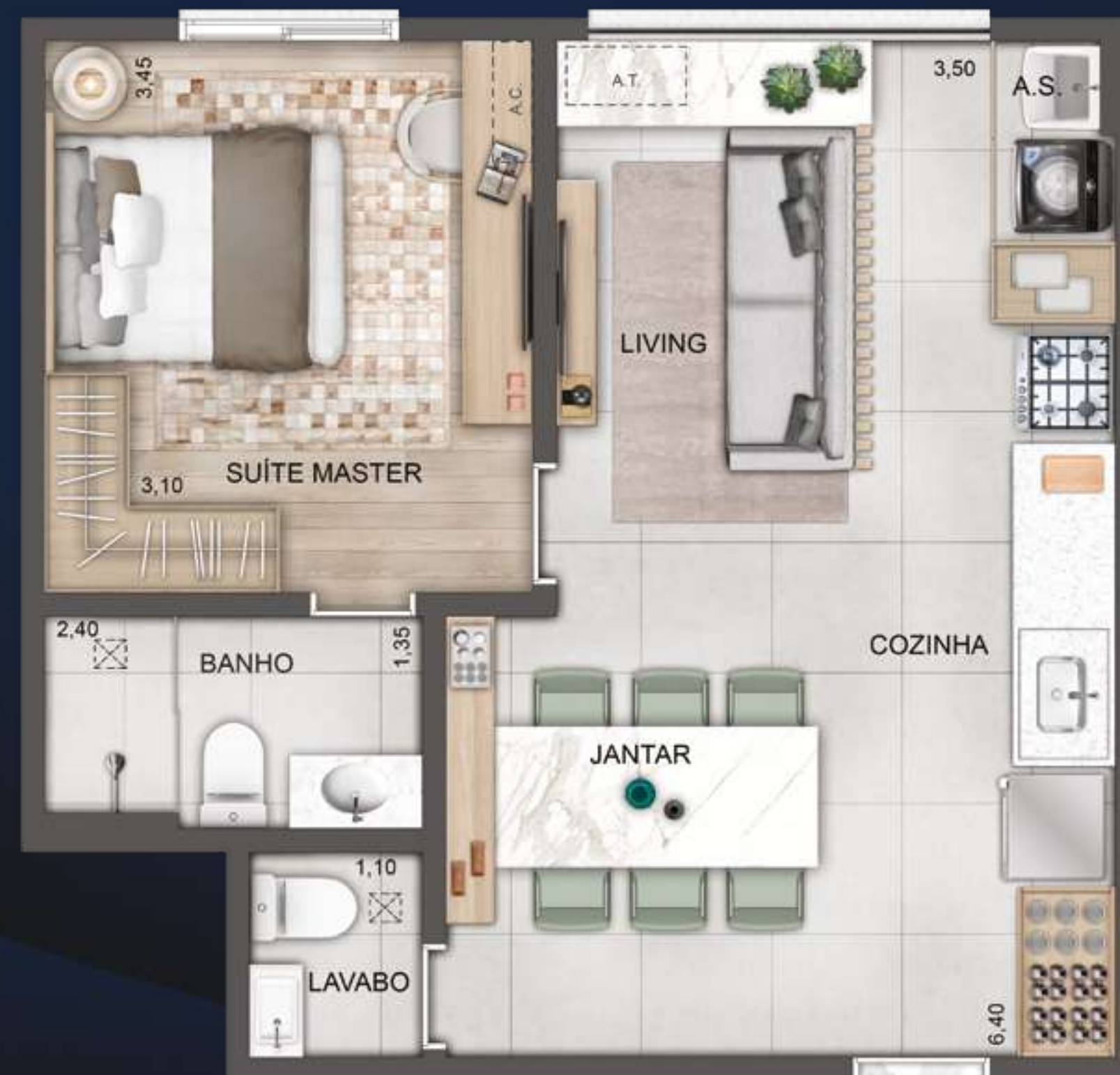
SUÍTE | LAVABO | LIVING AMPLIADO