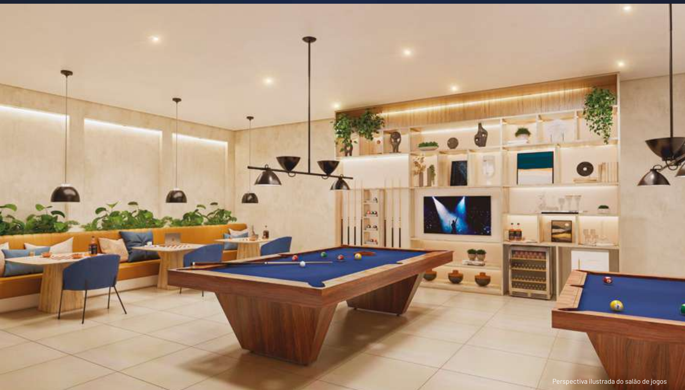
Perspectiva ilustrada do salão de jogos